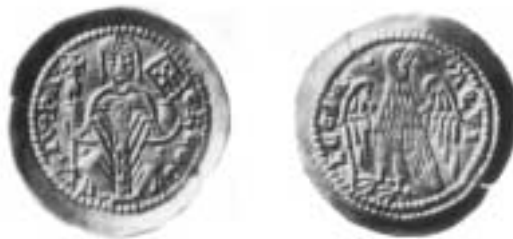
Denaro aquileiese del patriarca Gregorio da Montelongo (1251 - 1269) rappresentante al dritto il patriarca seduto di fronte con lunga croce e libro ed al rovescio un'aquila con ali aperte volta a destra.

privati, ma purtroppo la maggior parte degli esemplari era male conservata in quanto o fortemente ossidata dalla lunga permanenza nel sottosuolo o incrostata in modo tenacissimo, tant'è che al primo tentativo di togliere l'incrostazione, la moneta si sfaldava sbriciolandosi e diventava indecifrabile.