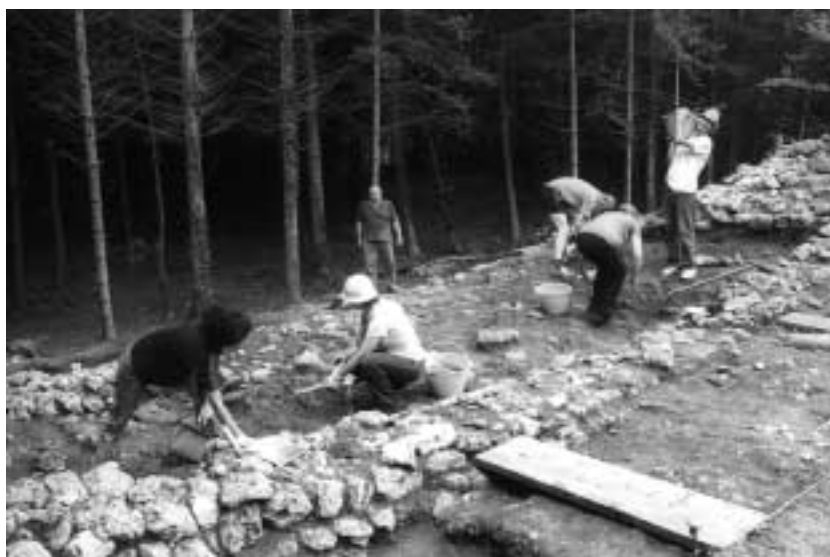
Verzegnis - Colle Mazéit

la distruzione. I livelli con tracce di combustione, quindi, sono di vario tipo e conglobano materiali di momenti cronologici dilatati nel tempo. Innanzi tutto è stato rilevato uno strato di malta sciolta con pietrisco arrossato in seguito al contatto col fuoco e la cui genesi è da connettere ad attività costruttive, contenente frammenti ceramici altomedievali. Il deposito sottostan-