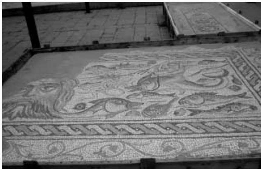
Luni, l'area dedicata ai mosaici.

Nella scorsa primavera, la Società ha effettuato una "uscita culturale" a Pisa, per visitare il cantiere di scavo delle navi romane, a Lucca, a Pontremoli, per visitare il Museo delle Statue Stele ed a Luni, per visitare l'area archeologica della città romana.