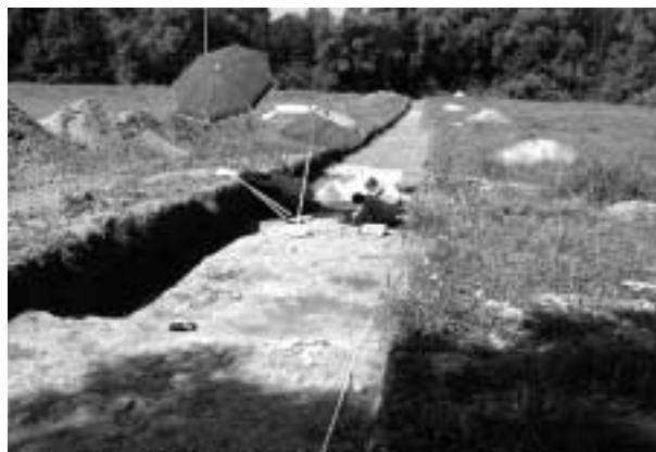
Trincea A: panoramica est-ovest