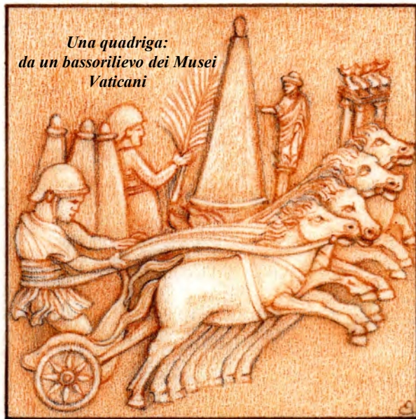
Una quadriga: da un bassorilievo dei Musei Vaticani

Al nascere dell'era imperiale l' Urbe dispensava brividi esistenziali dieci volte al giorno, dall'alba al tramonto, moltiplicatisi in un progressivo crescendo, ventiquattro corse promosse dal grande "giocherellone" Caligola, da trenta a quarantotto con i Flavi, sino all'esasperazione di Domiziano che programmò cento corse al giorno, limitate da sette a cinque giri, che esaltavano romanamente il "gioco della vita".