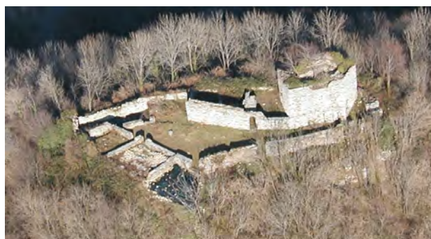
Attimis: Castello Superiore