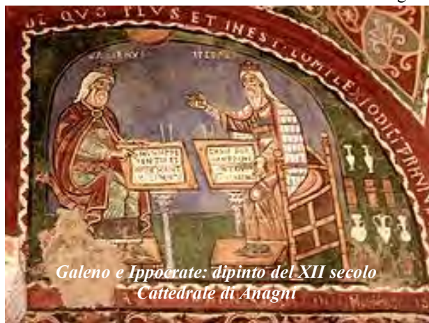
Galeno e Ippocrate: dipinto del XII secolo Cattedrale di Anagni

Un primo rilievo in medicina la ebbe dopo Ippocrate. Si dice che provenisse dalla prescrizione dei medici alessandrini (III secolo a.C.), in particolare contro lo stesso veleno delle vipere. La vipera, infatti, nella medicina antica era un forte simbolo magico,