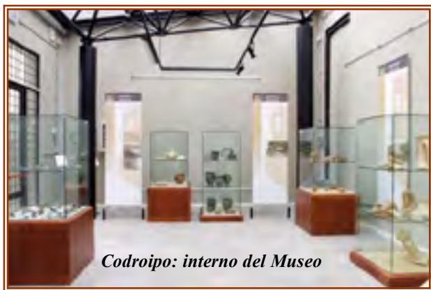
Codroipo: interno del Museo

Sorprende che in un recente convegno internazionale, a Bologna, i relatori abbiano sostenuto con forza che il futuro è tutto nei mini-musei, cioè nei musei locali, piccoli e magari specializzati. Infatti, in questo modo si potrebbe puntare a una clientela selezionata; i visitatori sarebbero "coccolati" e seguiti costantemente durante il percorso di visita; l'allestimento sarebbe variabile; verrebbero esposti