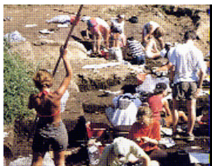
Pozzuolo del Friuli: Sammardenchia, attività di scavo.

L'insediamento, risalente al neolitico (il più importante e vasto in Italia settentrionale), è stato individuato nei primi anni Ottanta del sec. scorso nella zona agricola denominata Cueis. Nel corso delle varie campagne di scavo sono state messe in luce oltre 90 sottostrutture insediative date da cavità di differenti forme, dimensioni e funzioni. I reperti recuperati dagli scavi sono abbondanti. Nell'industria litica sono presenti nuclei ricavati da ciottoli di selce alluvionale e da arnioni di selce alpina. Sono presenti numerosi strumenti con usure lucide, come pure ossidiana carpatica e liparota. Tra le pietre levigate, di prevalente provenienza dalle Alpi Occidentali (giadeiti, eclogiti ed altre pietre verdi), si annoverano anelloni, scalpelli, accette, asce, macine e macinelli in arenaria.