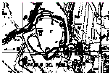
Pozzuolo del Friuli: l'are dei due castellieri.

Le ricerche hanno evidenziato una continuità di frequentazione dall'età del bronzo recente sino al periodo tardoantico (XIII a.C. - IV d.C.). In particolare è stato scoperto un deposito, composto da frammenti di vasi d'uso comune, resti di pasto, interpretato come un settore di servizio adibito ad attività produttive ed utilizzato dal XIII al X sec. a.C. Alcune buche per pali hanno invece evidenziato la presenza di strutture probabilmente a tettoia. Altre strutture abitative sono state segnalate dal rinvenimento di piani in terra e argilla battuta ed acciottolati.