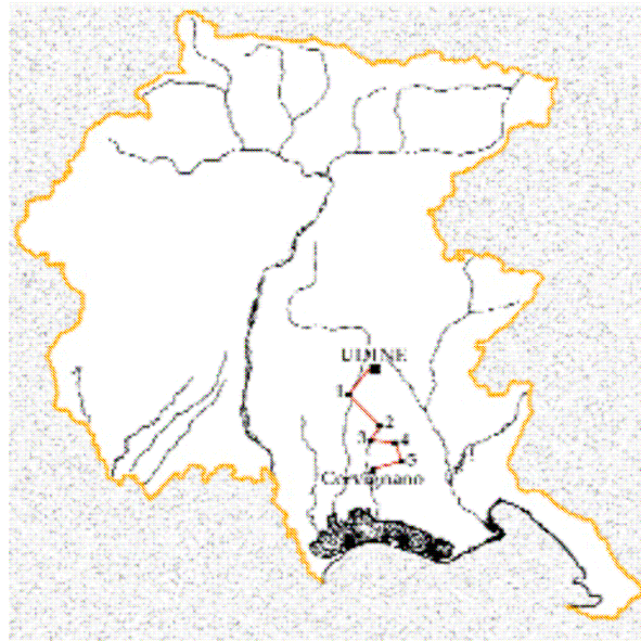
1. Pozzuolo del Friuli – 2. Palmanova – 3. Bagnarla Arsa – 4. Aiello – 5. Ruda

La pianura friulana offre, nell'arco di una ventina di chilometri, la visibilità di importanti testimonianze architettoniche che investono due millenni di storia: dall'opulenta epoca romana al tenebroso Medioevo, dalla rinascita cinquecentesca ai fasti sette – ottocenteschi. Ognuna di esse, con il proprio fascino, fa immergere il visitatore nella suggestione dell'epoca nella quale sorse.