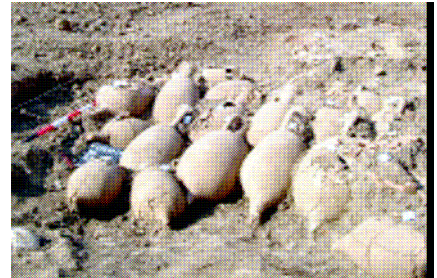
Bagnarla Arsa: Sevegliano, ritrovamento di anfore romane.

A completamento delle testimonianze romane in loco si sono rinvenute tracce di una bottega per la produzione del vetro. I reperti si trovano presso i Civici Musei di Udine, ove una parte è esposta.