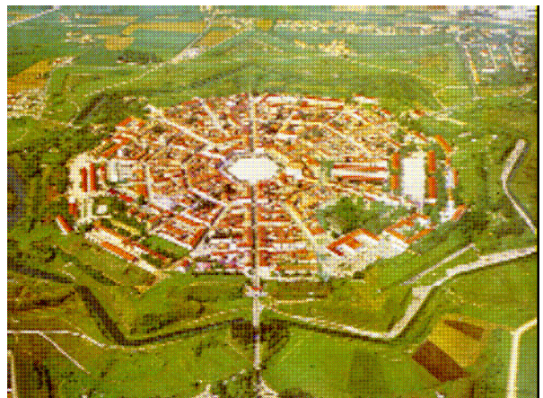
Palmanova: come si presenta oggi.

Nelle immediate vicinanze della fortezza, in località Jalmicco, sono stati rinvenuti resti, oggi non visibili, di un insediamento d'epoca romana di notevoli dimensioni.